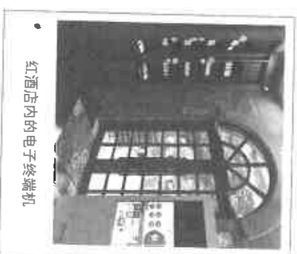
红酒店内的电子终端机