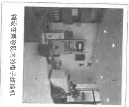
铺设在美容院内的电子终端机